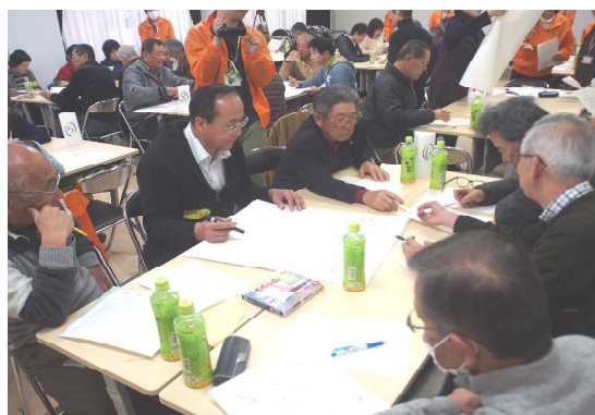
グループ作業風景

この演習課題を初めて使ってみたのは、南あわじ市社会福祉協議会主催の講座でした。各グループに模造紙を配布し、これからどういうことに取り組んだらいいのか考えていただいたのですが、初めは「何をしたらいいのか」が分からずに、皆さん当惑していました。