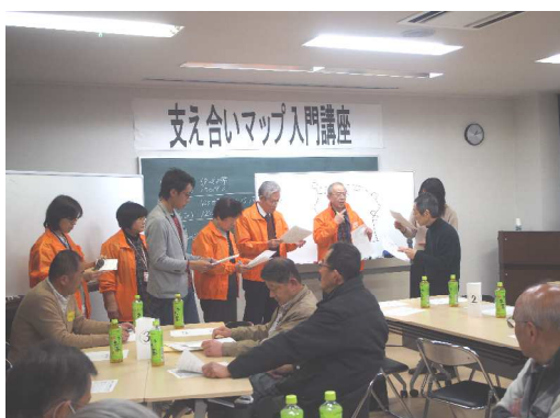
寸劇を皆さんで実演

本冊子で紹介している寸劇とは別に、演習課題用の寸劇シナリオも作成してあります。こちらは、聴取役が「こういうことをやったらどうでしょうか？」と具体的な取り組みを提案する箇所を、シナリオの中からすべて省いてあります。その省略版のシナリオを参加者が実演した後に、取り組み課題をグループで考えてもらうのです。聴取役による提案があれば、これからどういうことに取り組んだらいいのか、最後にまとめるのは比較的容易ですが、それが省略されていると、途端に難しくなります。